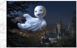
Das kleine Gespenst