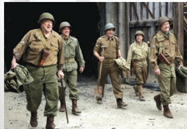
Monuments Men – Ungewöhnliche Helden