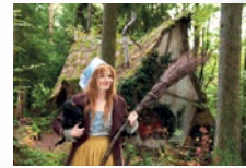
Die kleine Hexe