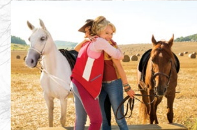
Bibi & Tina – Mädchen gegen Jungs