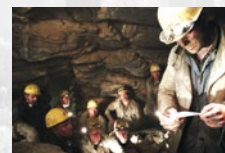
Das Wunder von Lengede