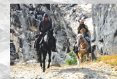
1 ½ Ritter – Auf der Suche nach der hinreißenden Herzelinde