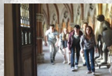
Allein gegen die Zeit